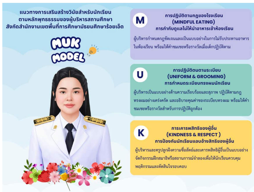
ภาพประกอบ 2 องค์ความรู้จากการวิจัย MUK MODEL