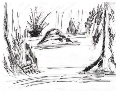
ภาพที่ 1 เวทีและฉากในการสร้างสรรค์ละครร่วมสมัย เรื่องนิ้วสุดท้าย

2.7.3 ฉากปรากฏพระวรกายของพระพุทธเจ้า จัดเป็นฉากพิเศษ ประกอบด้วยภาพวาดแบน เช่น ต้นไม้ ภูเขา ส่วนภาพลอยตัวสามมิติ คือ ดอกบัวใหญ่สีแดงให้พระพุทธเจ้าเข้าไปยืนได้ ต้นไม้ (อาจเป็นของจริง หรือทำจากวัสดุโครงลวด กระดาษสี) เวทีและฉาก