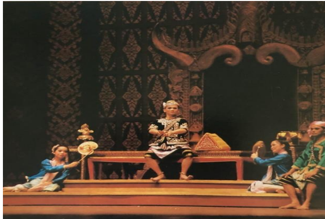
ภาพที่ 3 ฉากท้องพระโรงกรุงอังวะ

ที่มา : หนังสือบทละครพันทางเรื่องผู้ชนะสิบทิศ สมาคมภริยาทหารเรือจัดพิมพ์ เพื่อมูลนิธิสายใจไทย พ.ศ. 2534