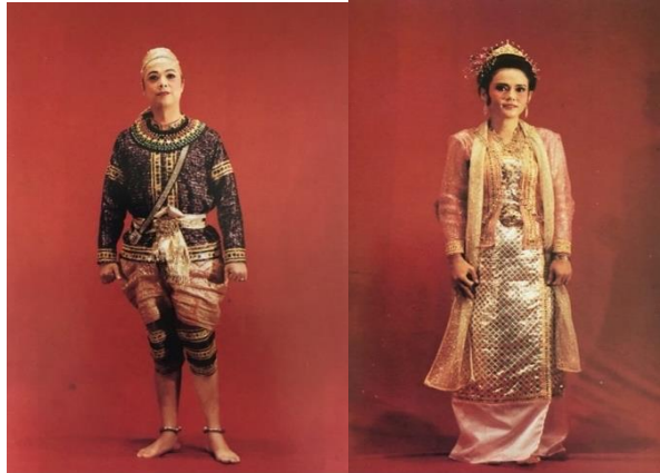
ภาพที่ 2 เครื่องแต่งกายชายมอญตัวละครสการะวุฒพีและหญิงมอญพระมเหสี ที่มา : หนังสือบทละครพันทางเรื่องผู้ชนะสิบทิศ สมาคมภริยาทหารเรือจัดพิมพ์ เพื่อมูลนิธิสายใจไทยพ.ศ. 2534

ผู้หญิง นุ่งผ้าชิ้นลายทาง เสื้อคอตั้ง แขนยาวคลุมสะโพกเข้ารูป มักจะใส่สีอ่อนๆ เช่น สีชมพู สีฟ้า สีเขียว หม่อมสไบเฉียง เก้าฝนมสูงทัดดอกไม้ด้านขวา