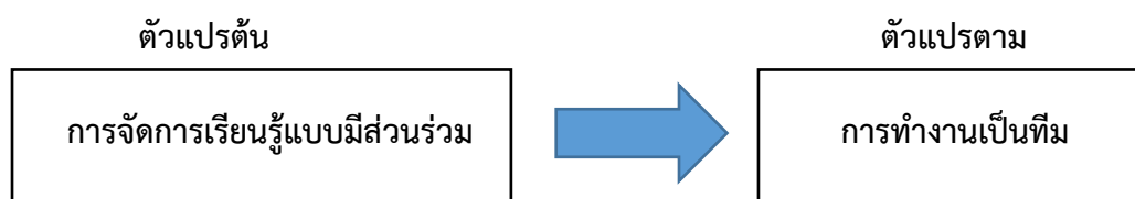
ภาพที่ 1 กรอบแนวคิดในการวิจัย

การทำงานเป็นทีมมีความสำคัญอย่างยิ่งต่อความสำเร็จขององค์กรหรือหน่วยงานต่างๆ เนื่องจากช่วยเสริมสร้างประสิทธิภาพในการปฏิบัติงาน ลดความขัดแย้งภายในกลุ่ม เกิดการเรียนรู้ระหว่างกัน และสามารถตัดสินใจร่วมกันอย่างรอบคอบ อีกทั้งยังช่วยส่งเสริมทักษะทางสังคม ความร่วมมือ และความรับผิดชอบในหน้าที่ที่ได้รับมอบหมาย (ทัศนีย์ เกษศิริ, 2562)