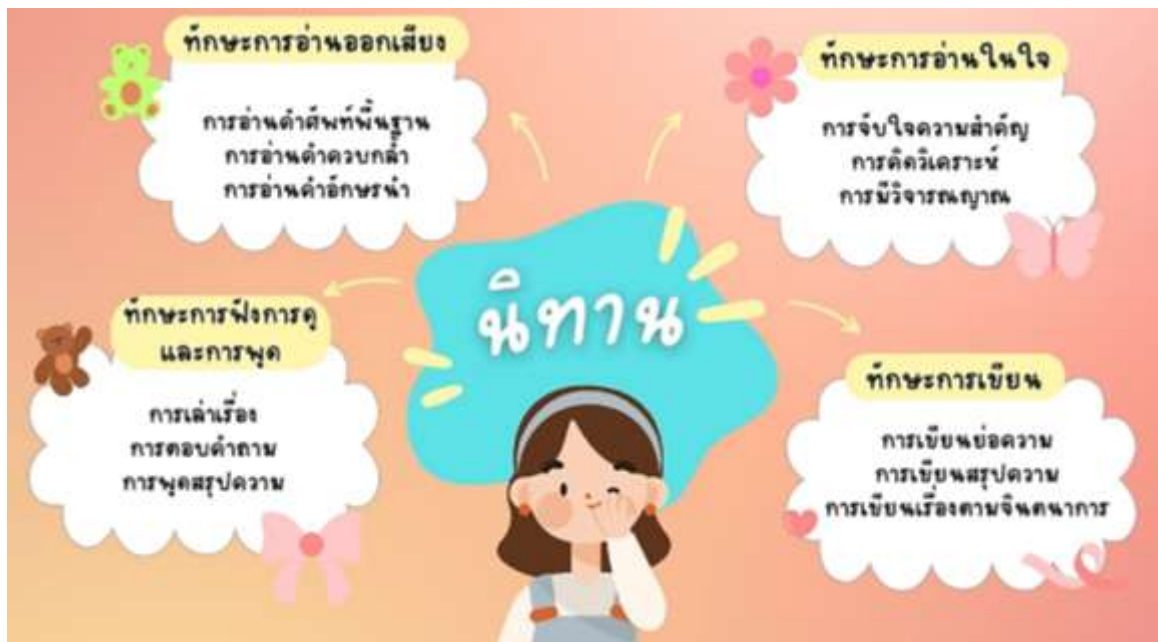
ภาพที่ 2 องค์ความรู้ใหม่ที่ได้จากการวิจัย

จากการวิจัยนี้ องค์ความรู้ใหม่ที่ได้จากการวิจัย ได้แก่ แนวทางในการจัดกิจกรรมการเรียนรู้ที่หลากหลายและน่าสนใจ เนื่องจากนิทานเป็นสื่อชนิดหนึ่งที่สามารถเข้าถึงผู้เรียนได้ทุกเพศ ทุกวัย นอกจากนี้ นิทานยังสามารถช่วยกระตุ้นจินตนาการของผู้เรียน ฝึกการจับประเด็นและวิเคราะห์ได้ดี เช่น นิทาน สามารถ